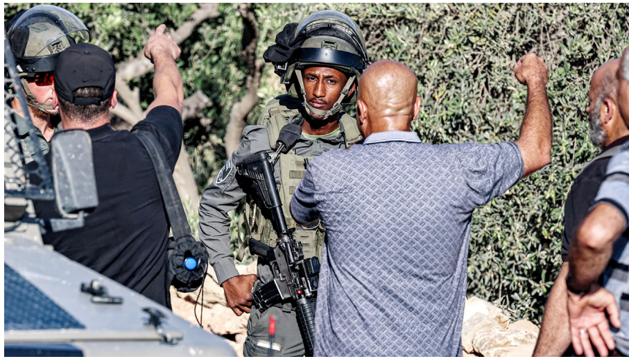
جنود الاحتلال يقمعون وقفة احتجاجية في دير أبو مشعل ضد الاستيطان.

محافظات- مراسلو-ا.ف.ب- وكالات- صدع المستوطنون، أمس، هجماتهم ضد التجمعات البدوية في مناطق متفرقة من الضفة الغربية، بالتزامن مع اقتحام جيش الاحتلال عدة بلدات. وفي التفاصيل هاجم مستوطنون، تجمع عرب الكعابنة شرق بلدة الطيبة شرقي رام الله، برفقة الطبية شرفي رام الله، برفقة مواشيهم، وأقدموا على قطع خطوط الكهرباء والمياه التي تخدم المواطنين. وقالت منظمة البيدر الحقوقية إن هذا الاعتداء تسبب بحرمان المواطنين من خدمات أساسية، ويأتي ضمن سلسلة من الانتهاكات المتواصلة التي تستهدف التجمعات البدوية. تمتعة ص ١٥