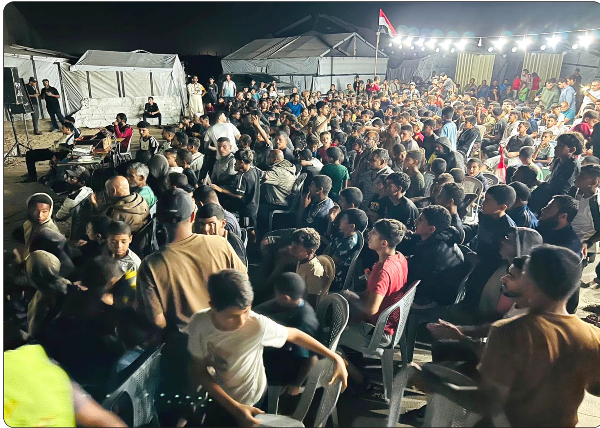
جماهير غفيرة حضرت لقاء مصر بلجيكا في غزة

غزة- وكالات - عاش فلسطينيو قطاع غزة، أجواء «حماسية» أثناء متابعتهم مباراة مصر وبلجيكا ضمن منافسات كأس العالم 2026، في مشاهد عكست تفاعلا جماهيريا لافتا مع الحدث الرياضي العالمي. ظهر عدد من المواطنين وهم يتابعون اللقاء عبر شاشات عرض في أماكن عامة ومقاهٍ، حيث سادت أجواء من الحماس والتشجيع طوال مجريات المباراة، وسط تفاعل واضح مع أداء المنتخب المصري.