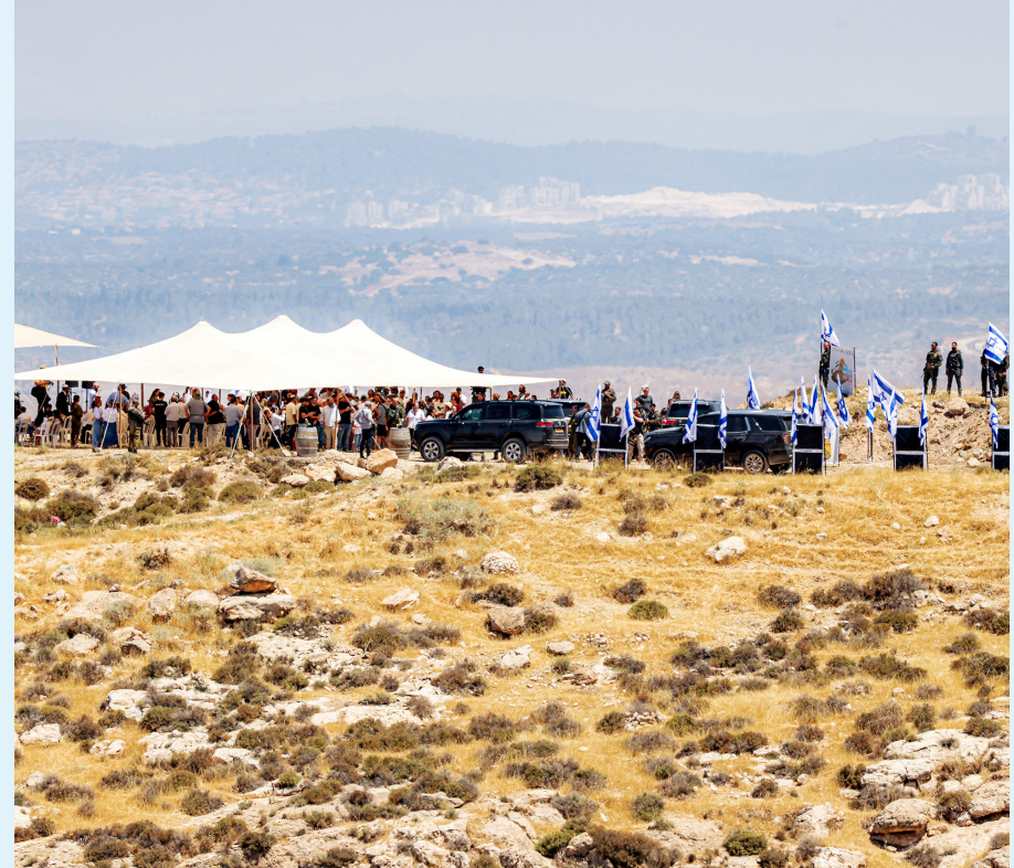
مستوطنون برفقة سموتريتش يفتتحون أمس مستوطنة جديدة غرب الخليل.

تل أبيب- وكالات- اذعت- أعلن وزير المالية الإسرائيلي بتسلئيل سموتريتش، أمس، إلغاء "اتفاقية الخليل"، وسحب صلاحياتها ونقلها إلى إسرائيل. جاء ذلك وفق ما أعلنه سموتريتش، وهو أيضاً وزير الخليل، ووزارة جيش الاحتلال خلال افتتاحه مستوطنة "دورين" في جبل الخليل. وقال سموتريتش: "ألغينا اتفاقية الخليل. وطوال سنوات بقي أحد بنود أوأسلو الأكثر تناقضاً كما هو، وتمتعة ص ١٥