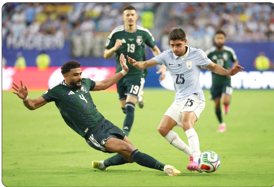
■ من لقاء السعودية وأوروغواي

في المقابل، قدم منتخب الرأس الأخضر أداءً تكتيكياً وبدنياً قوياً في ظهوره لخطورة حقيقية عبر وشكل خطورة حقيقية عبر هجمات مرتدة متأخرة كادت أن تمنحه انتصاراً تاريخياً، لينتهي اللقاء بنقطة ثمينة للرأس الأخضر وصادمة للإسباني.