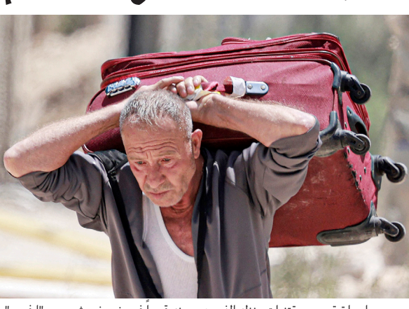
مسن يحمل ما تبقى من مقتنيات منزله الذي هجر منه قسراً في مخيم نور شمس.

لم يتمكنوا من التعرف على مواقع منازلهم بسبب الهدم الواسع نازحون يعودون لساعات إلى نور شمس لجمع مقتنياتهم