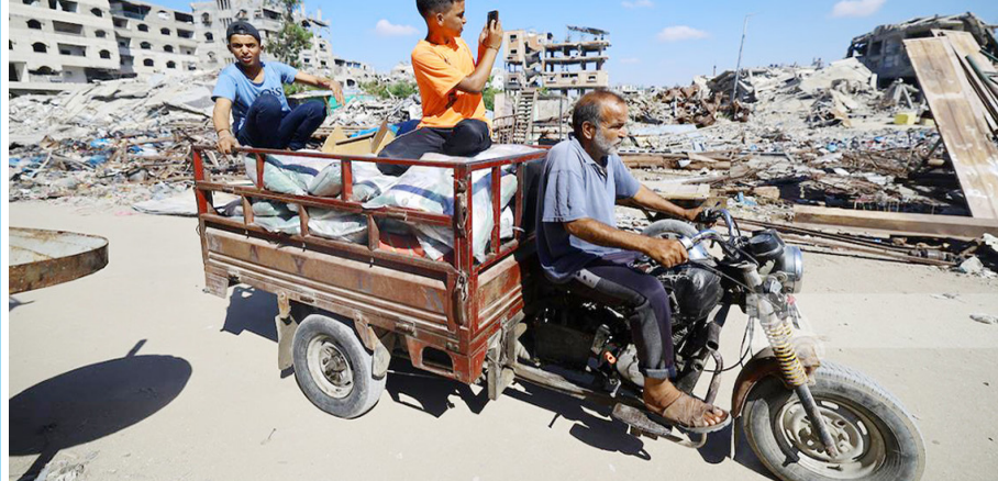
نازحون يحملون مقتنياتهم بعد توغل آليات الاحتلال شرق غزة.

غزة- اذعت- استشهد مواطنان، وأصيب آخرون أمس، جراء قصف نفذته طائفة مسيرة في محيط برج النوري شمالي مخيم النصيرات وسط قطاع غزة. وشهدت مناطق متفرقة من قطاع غزة، تصعيداً ميدانياً جديداً مع مواصلة قوات الاحتلال عمليات القصف للدفعي وإطلاق النار في خرق متواصل لاتفاق وقف إطلاق النار. وأصيب مواطنان برصاص قوات الاحتلال في محيط دوار بيت لاهيا شمال غربي القطاع، كما أصيب مواطن بالرصاص في منطقة العطارطة. تمتعة ص ١٥