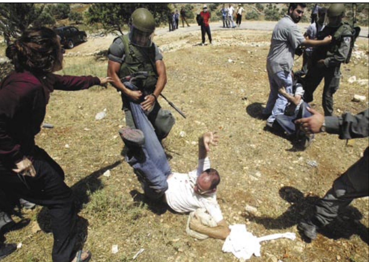
بلعين رام الله - جندي اسرائيلي يسحب ناشط سلام من قدمه خلال تفريق تظاهرة احتجاج على جدار الفصل هنا امس.