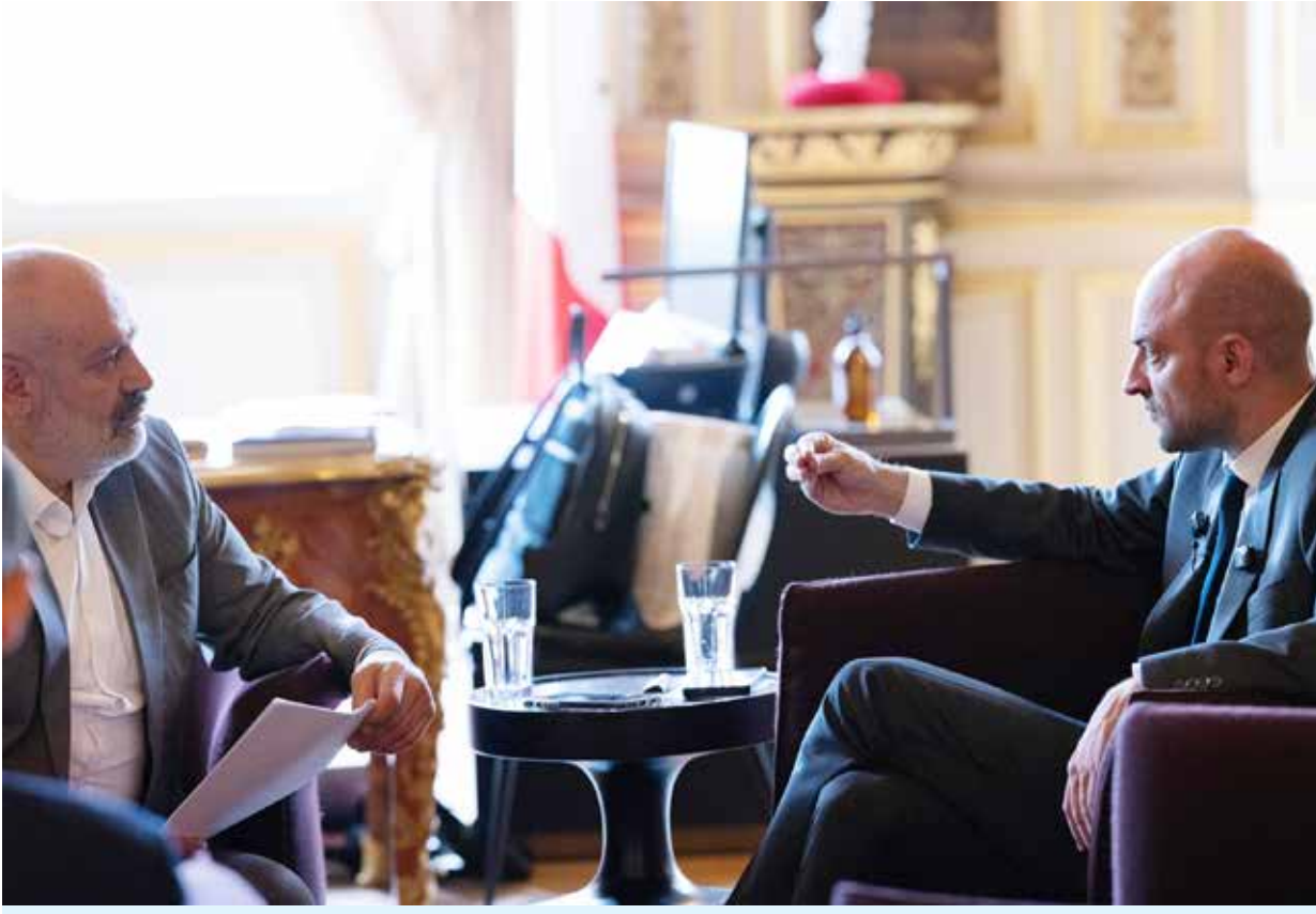
جان نويل بارو، وزير أوروبا والشؤون الخارجية، خلال حواره مع الزميل محمد أبو خضير.

وخارجها. وتبدّل فضيلتنا العامة في القدس أقصى ما في وسعها لدعم الجماعات التي تستهدها أعمال العنف المُنظرّفة.