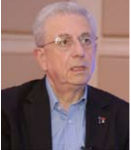
د. مصطفى البرغوثي

في خضم المراسيم المتلاحقة وحالة الارتباك التي تسود الساحة الفلسطينية في غياب الاستراتيجية الوطنية الموحدة، والقواعد الناظمة للحياة السياسية الديمقراطية، وفي وضع يواجه فيه الشعب الفلسطيني أخطر التحديات في تاريخه أمام حرب الإبادة، ومخططات التطهير العرقي، وهجمات الإرهاب الاستيطانية، يبدو التناقض صارخاً بين احتياجات النضال والواجهة، والدفاع عن الشعب الفلسطيني، ومستوى البنين الداخلي الفلسطيني للطلاب بتلبية هذه الاحتياجات.