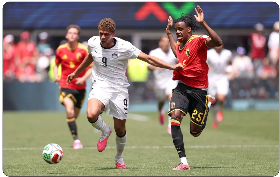
■ من لقاء مصر بلجيكا

أما صحيفة «يو إس إيه توداي» فأشارت إلى أن المنتخب المصري قدم أداءً جيداً أمام نظيره البلجيكي، المرشح الأقوى، قبل المباراة. وأشادت صحيفة «سياتل تايمز» بأجواء المباراة وامتلأه اللعب بالجماهير مشيرة إلى قوة منتخب بلجيكا الذي يحتل المركز التاسع في التصنيف العالمي، وقد تصدر المنتخب البلجيكي التصنيف العالمي لأربع سنوات متتالية (بين عامي 2018 و2021). وبعد دقائق من نهاية مباراة السعودية وأوروغواي بالتعادل بهدف لثله تساءلت صحيفة «ذا أثلتيك» بدهشة عن سيكون الفريق الأضعف في المجموعة الثامنة بعدما فرضت السعودية التعادل بعد ساعات من موقعة إسبانيا والرأس الأخضر في المجموعة ذاتها التي انتهت أيضاً بالتعادل. وأضافت «ذا أثلتيك» أن مفاجأة أخرى كانت على وشك الحدوث لولا هدف التعادل المتأخر الذي سجلته أوروغواي في الشباك السعودية.