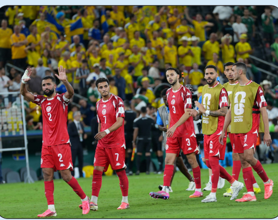
■ حسرة تونسية