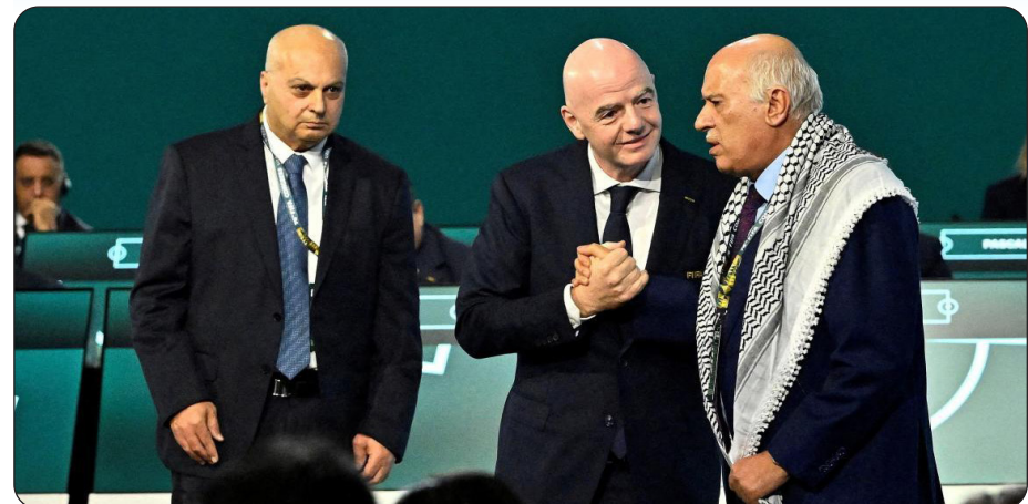
الفريق الرجوب غاضب من عدم تجاوب إيفانتينو مع الطالب الفلسطينية

صحافة عالمية - يفكر الاتحاد الدولي لكرة القدم في برمجة مباراة رمزية بين منتخبي فلسطين وإسرائيل في افتتاح بطولة جديدة للناشئين تحت 15 عاماً ستقام في الولايات المتحدة في سبتمبر المقبل، وفق ما نقلته صحيفة الغارديان