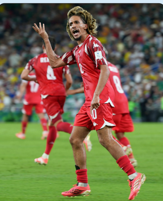
■ نجم تونس حنبعل للجبري