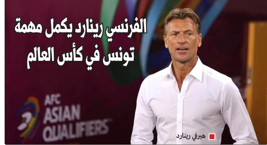
■ هيري رينارد

صحافة أجنبية - تباينت تعليقات الصحف العالمية على أداء مصر والسعودية في مباراتي الجولة الأولى للمنتخبين، حيث تعادلت مصر بهدف لثله أمام منتخب بلجيكا، وخرجت السعودية بالنتيجة ذاتها من مواجهة أوروغواي. قال إن بلجيكا عادت في النتيجة لتحرر مصر من أول فوز لها في كأس العالم، مشيرة إلى مشاركة لوكاكو في الشوط الثاني ساعدت بلجيكا في انتزاع نقطة التعادل، بعدما كان إمام عاشور افتتح التسجيل لصالح المنتخب المصري. أما صحيفة «الغارديان» البريطانية فقالت: إنه لأكثر من نصف زمن المباراة الافتتاحية لمصر أمام بلجيكا بدا وكأن «الفراغنة» قد أنجزوا ما يكفي لتحقيق فوز تاريخي أول في كأس العالم. ولكن، حينها لجأ مدرب بلجيكا رودي غارسيا إلى دكة البدلاء وأشرك اللاعب الذي طالما اعتمدت عليه بلجيكا في المواقف العصيبة وهو لوكاكو.