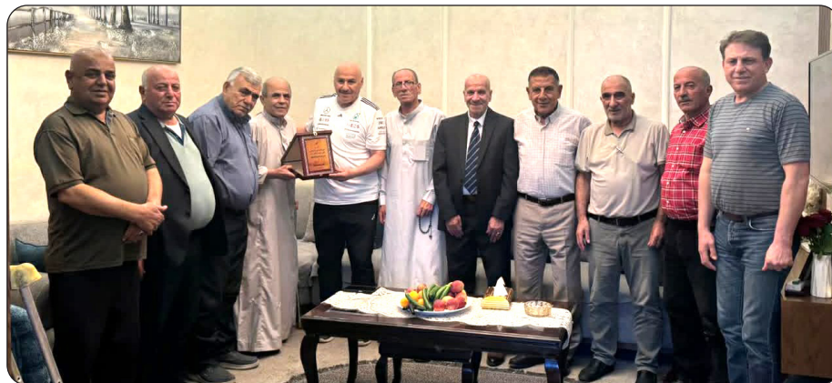
قدامى شباب الخليل

يكونون في الأماكن العامة. وقال أبو رزق: "ممكّن يتم استهداف القهه ممكن وأنا طالع من المباراة اللي بحضرها حاليا يتم استهداف أي شيء بجانب وأفارق الحياة، لكن بالرغم من كل شغلة إحنا بنعاني منها إحنا مستمرين وراح نشاهد المباراة بالرغم من كل الأشياء اللي إحنا بنواجهها".