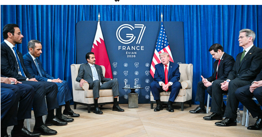
جانب من الاجتماع الذي عقد بين الرئيس الأمريكي وأمير قطر على هامش قمة السبع في فرنسا أمس.

إيفيان- ا.ف.ب- وكالات- قال الرئيس الأمريكي دونالد ترمب، أمس، إنه اقترح على إسرائيل أن يتولى الرئيس السوري أحمد الشرع أمر حزب الله اللبناني للدعم من طهران، وأشاد ترمب خلال اجتماعه مع أمير دولة قطر الشيخ تميم بن حمد آل ثاني، في إيفيان بفرنسا، على هامش أعمال قمة مجموعة السبع، بالشرع الذي قال إنه يقوم "بعمل مذهل"، مضيفاً خلال قمة مجموعة السبع "إذ لم تتمكن إسرائيل من إنجاز المهمة (ضد حزب الله) من دون قتل الجميع، تمتعة ص ١٥