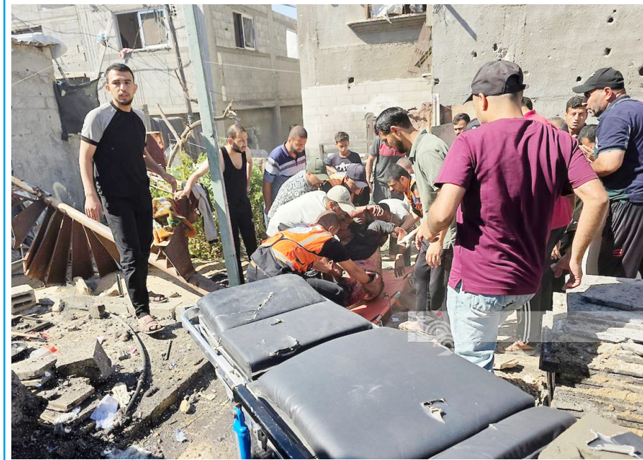
إجلاء مصابين إثر قصف خيمة للنازحين في مواصي خان يونس.

غزة - وفا- استشهد مواطن وأصيب آخرون، بينهم أربعة أطفال، مساء أمس، جراء قصف لقوات الاحتلال على منطقة الواصي غرب خان يونس، جنوب قطاع غزة. وأفاد مراسل وفا" بأن القصف استهدف خيمة تؤولي نازحين في منطقة الواصي، مشيراً إلى أن المصابين نقلوا إلى مستشفى ناصر في مدينة خان يونس، حيث أعلن عن استشهاد أحدهم متأثراً بإصابته. وكانت مصادر طبية في قطاع غزة قد أعلنت الخميس، ارتفاع حصيلة عدوان الاحتلال إلى ٧٣,٠١٨ شهيدا، و١٧٣,٢٧٣ مصابا، منذ السابع من تشرين الأول/ أكتوبر ٢٠٢٣، مبيّنة أن إجمالي الشهداء منذ وقف إطلاق النار في ١١ تشرين الأول قد ارتفع إلى ١٠٧,٠٠٠ والإصابات إلى ٣٠,٣١٥.