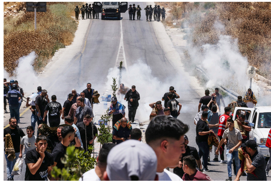
جنود الاحتلال يعتدون بالغاز على جموع أهالي جبل طاروسا للهدد بالمصادرة.

محافظات- وفا- شهدت محافظات الضفة، أمس، سلسلة واسعة من اعتداءات قوات الاحتلال والمستوطنين، تركزت في مناطق مهددة بالاستيلاء والتوسع الاستيطاني، وأسفرت عن إصابات بالاختناق واعتقالات واعتداءات على المواطنين وممتلكاتهم، في وقت واصل فيه المواطنون فعاليتهم الشعبية الراضة للاستيطان ومصادرة الأراضي. في مسافر بظا جنوب محافظة الخليل، شارك عشرات المواطنين في فعالية جماهيرية تخللتها إقامة صلاة الجمعة في منطقة خلة الحمص، على الأراضي الهدهدة بالاستيلاء من قبل الاحتلال والمستوطنين، تأكيدا على التمسك بالأرض ورفضاً لحاولات السيطرة عليها.