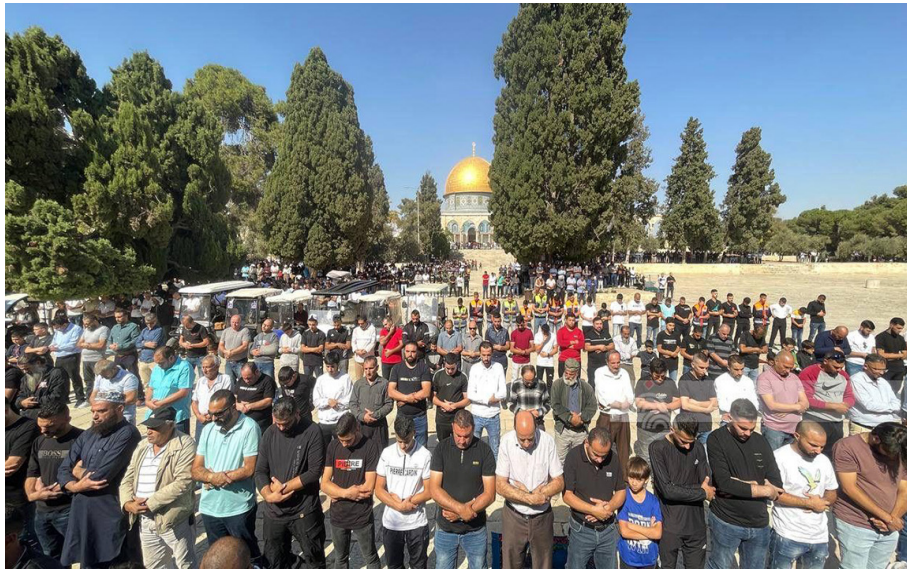
آلاف المصلين يؤدون الجمعة في رحاب المسجد الأقصى المبارك أمس.

القدس- محمد أبو خضير- رغم الإجراءات الإسرائيلية المشددة في القدس المحتلة، أدى عشرات الآلاف من المصلين صلاة الجمعة في المسجد الأقصى المبارك، وذلك في ظل تشديد أمني وعسكري على أبواب المدينة العتيقة، وأبواب للمسجد من الداخل والخارج. فقد نشرت شرطة الاحتلال، منذ ساعات الفجر الأولى، حواجز حديدية على أبواب المدينة المقدسة والمسجد الأقصى، ودققت في هويات المصلين، ومنعت العشرات من الشبان والمرايطين والمرايطات من الدخول. وأفادت دائرة الأوقاف الإسلامية في القدس بأن نحو ٦٠ ألف مصل أدوا صلاة الجمعة في المسجد الأقصى المبارك، وأن عشرات الآلاف توافدوا إليه.