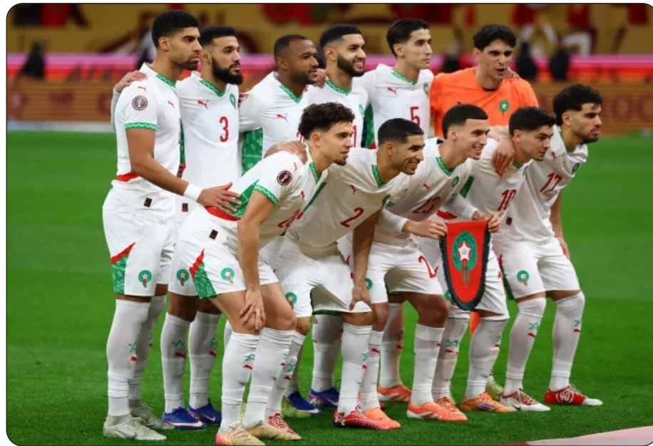
منتخب العرب يدافع عن إنجازاته في موندリアル قطر