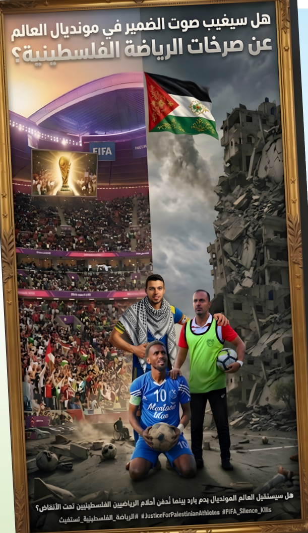
هل سيفيب صوت الضمير في مونديال العالم عن صرخات الرياضة الفلسطينية؟

في أول مشاركة له في نهائيات المونديال نجح المنتخب السعودي في التأهل عن مجموعته، بعد جمعه ست نقاط من فوزين، على المغرب 2-1، وعلى بلجيكا بهدف، وخسارة من هولندا 2-1، وفي الدور الثاني خسر من السويد 3-1، وكان أبرز نجوم تشكيلة المدرب الأرجنتيني خورخي سولاري في البطولة محمد الدعيع، وفؤاد أنور، وسعيد العويران، وسامي الجابر، وماجد عبد الله، وفهد الهريفي، وأحمد جميل، ومحمد عبد الجواد.