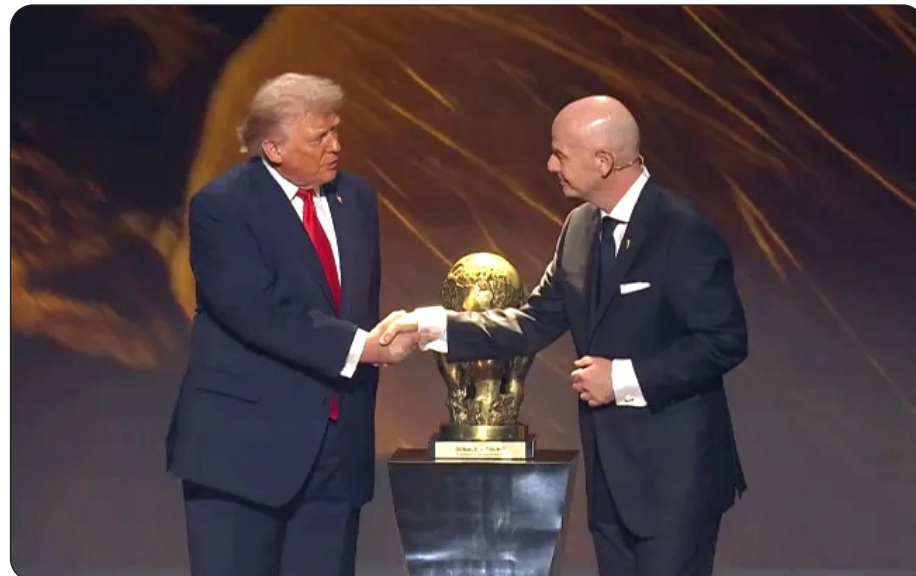
إنفانتينو منح ترامب جائزة فيفا للسلام

السلام، التي جاءت في وقت كان ترامب وإدارته يضغطان فيه مراراً وتكراراً لمنحه جائزة نوبل للسلام.