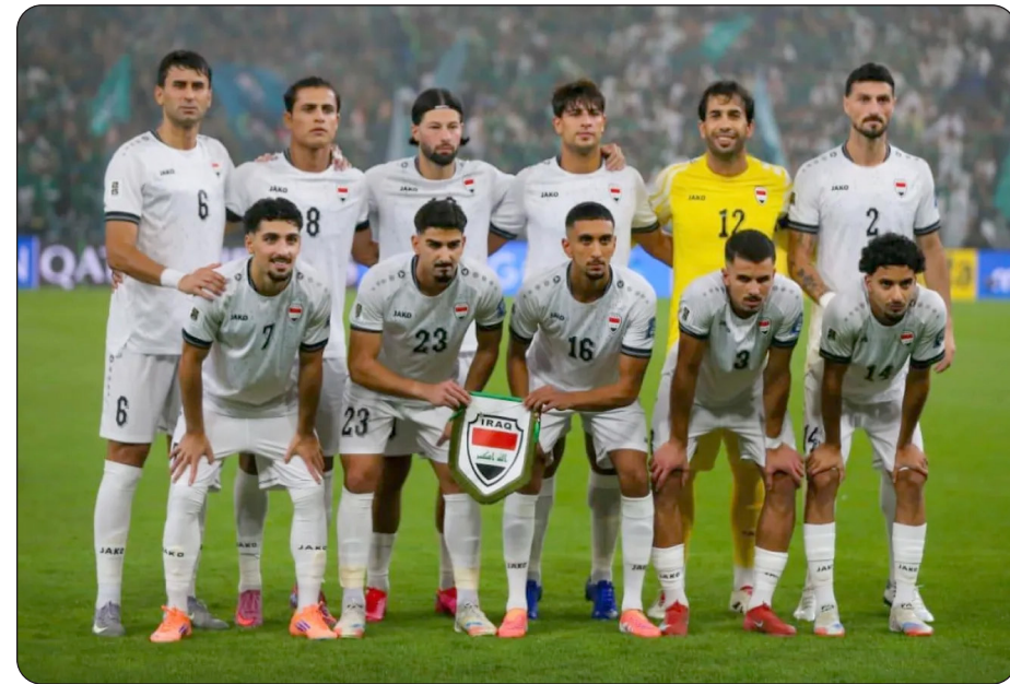
منتخب العراق يعود للموندリアル بعد 40 سنة