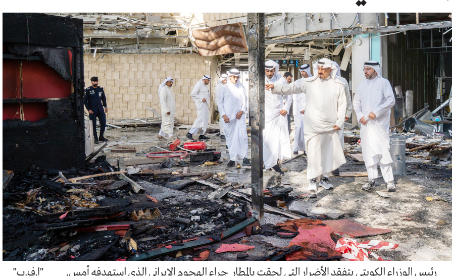
رئيس الوزراء الكويتي يتفقد الأضرار التي لحقت بالمطار جراء الهجوم الإيراني الذي استهدفه أمس.

الكويت-وكالات-أعلنت وزارة الصحة الكويتية مقتل شخص وإصابة ٦٣ آخرين، إلى جانب أضرار جسيمة طالت منشآت حيوية وبعثات دبلوماسية، في