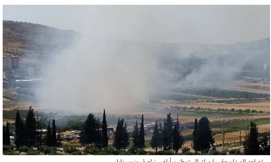
تصاعد الدخان عقب إحراق المستوطنين أراضي زراعية جنوب نابلس.

محافظات-مراسلو-وكالات-أحرق مستوطنون، أمس، أراضي زراعية، وهاجموا منازل في مناطق مختلفة بالضفة الغربية، بحماية جيش الاحتلال. ففي نابلس هاجم مستوطنون الأراضي الزراعية بين بلدتي أودلا وحوارة، وأضرمو النيران في مزروعات القمح فيها، ما أدى إلى احتراقها. ويأتي هذا بعد يوم من إقدام المستوطنين على إجرام النار بإطارات مطاطية، وإلقائها باتجاه الأراضي الزراعية الممتدة على الطريق بين الساوية والبلن الشرقية جنوب نابلس، ما أدى إلى احتراق مساحات واسعة من محصول القمح وأشجار الزيتون. ..تتمتع ص 15