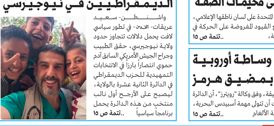
واشنطن-سعيد عريقات-أعلنت-في تطور سياسي لافت يحمل دلالات تتجاوز حدود ولاية نيوجيرسي، حقق الطبيب وجراح الجيش الأمريكي السابق آدم حموي انتصاراً بارزاً في الانتخابات التمهيدية للحزب الديمقراطي في الدائرة الثانية عشرة بالولاية، ليصبح على الأرجح أول نائب منتخب من هذه الدائرة يحمل برنامجاً سياسياً