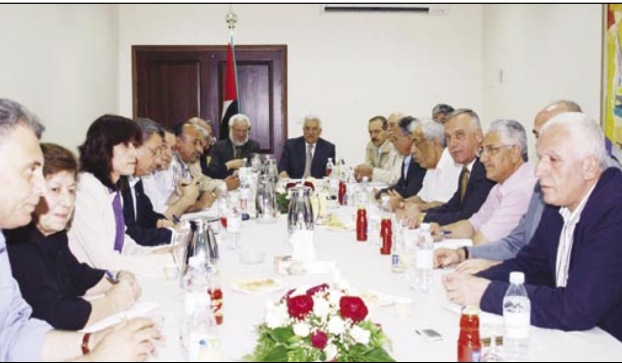
رام الله- جانب من اجتماع اللجنة العليا للحوار الوطني برئاسة الرئيس محمود عباس، ابو مازن، الذي عقد هنا امس.

رام الله- من زياد ابو يوسف- أكد الرئيس محمود عباس انه سيبقى على موقفه فيما يتعلق بالمهلة الممنوحة للجنة الحوار الوطني، للاتفاق على وثيقة الوفاق الوطني، كما اطلع لجنة الحوار على نتائج محادثات العربية والدولية لرفع الحصار عن الشعب الفلسطيني. جاء ذلك خلال جلسة الحوار التي عقدت امس في مقر المقاطعة برام الله بحضور الرئيس عباس الذي اشار الى ان اصراره على موقفه يأتي في اطار الضغط الايجابي من اجل الوصول الى اتفاق وليس من اجل الضغط السلبي.