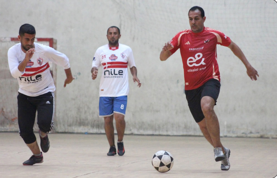
الزمالك والأهلي في غزة