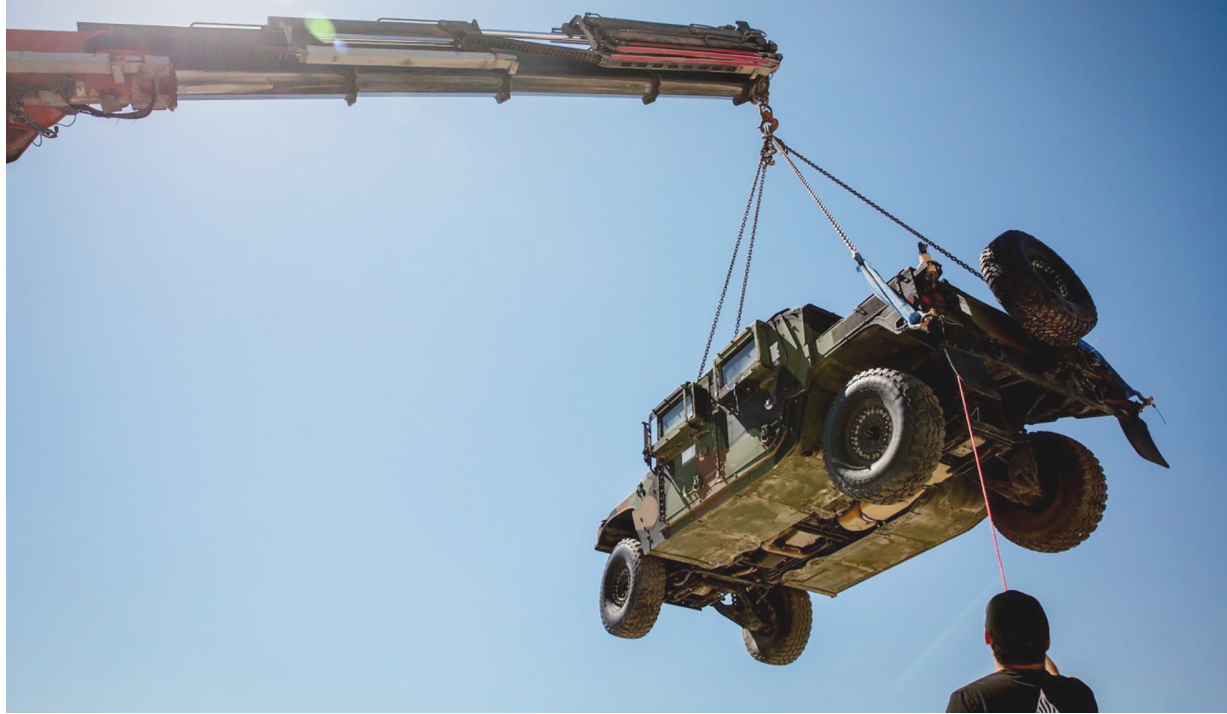
مركبة عسكرية تصل إلى مقر القوة الدولية في كرم أبو سالم أسس.