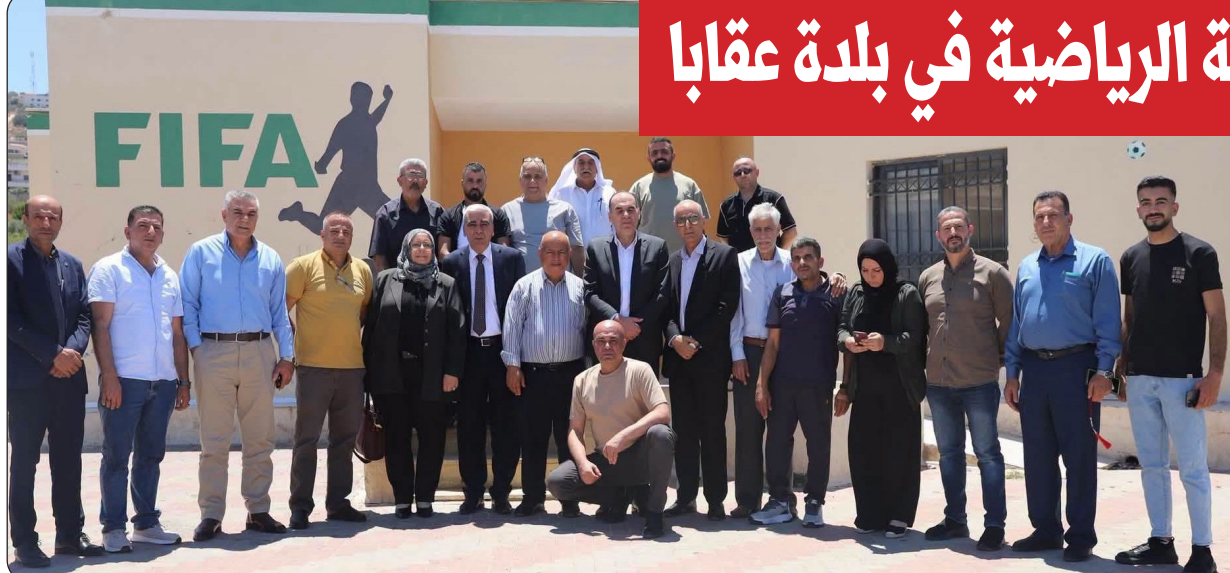
■ القدومي يتفقد نادي عقابا

عقابا - بحث الوزير عصام القدومي أمين عام المجلس الأعلى للشباب والرياضة أمس الثلاثاء واقع الحركة الرياضية في بلدة عقابا، وسبل دعم النادي وتطوير البنية التحتية الرياضية، بما يسهم في خدمة الشباب والارتقاء بالقطاع الرياضي في البلدة.