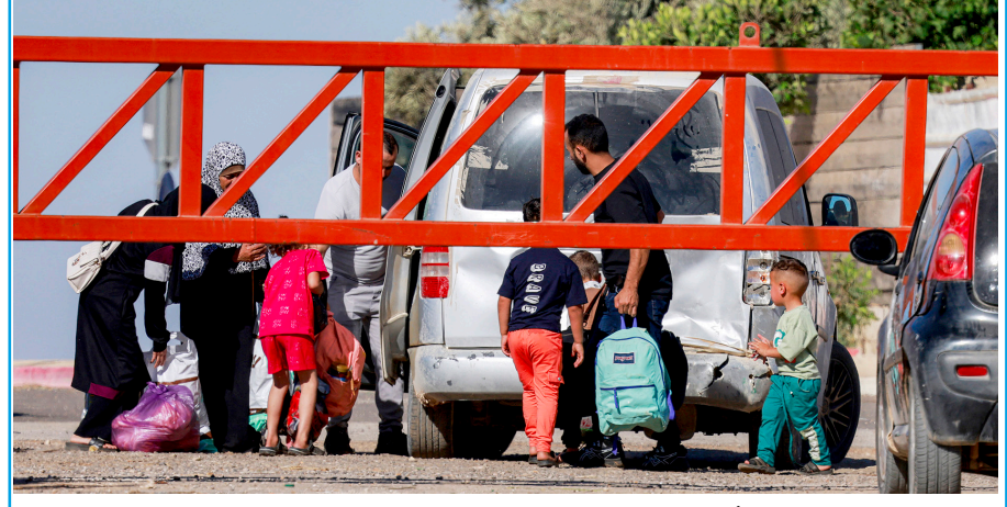
جانب من معاناة المواطنين أثناء اجتياهم البوابة الحديدية للنصوبة على مدخل قرية قصرة. "ا.ف.ب" محافظات- مراسلو اقتص- وكالات- صعدت قوات الاحتلال اعتداءاتها في الضفة الغربية، باقتحام معهد في قلنديا، وإغلاق جمعية خيرية في نابلس، وهدم ملعب مدرسي غرب بيت لحم، في إطار سلسلة إجراءات احتلال اعتداءاتها في الضفة الغربية، باقتحام معهد في قلنديا، وإغلاق جمعية خيرية في نابلس، وهدم ملعب مدرسي غرب بيت لحم، في إطار سلسلة إجراءات احتلال اعتداءاتها في الضفة الغربية، باقتحام معهد في قلنديا، وإغلاق جمعية خيرية في نابلس، وهدم التفاصيل 15

إغلاق مقر جمعية التضامن في نابلس وهدم ملعب مدرسة بتير