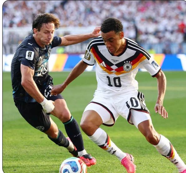
من لقاء ألمانيا وباراغواي

أسونسيون- وكالات - استيقظ سكان باراغواي أمس الثلاثاء على عطلة وطنية مفاجئة أعلنتها الحكومة، عقب الفوز غير المتوقع لمنتخب بلادهم على ألمانيا في بطولة كأس العالم لكرة القدم. وأعلن الرئيس سانتياغو بينيا هذه العطلة عبر منصة "إكس" فجر الثلاثاء، بعد فوز باراغواي على ألمانيا بنتيجة 3/4 بركلات الترجيح، عقب التعادل 1/1 في دور الـ 32. وفي منشوره الذي تضمن مرسوم إعلان العطلة، كتب بينيا: "اليوم، البلد بأكمله يحتفل". وأضاف: "إنه يحتفل بانتصار منتخب وطني يجسد جوهر هويتنا.. روح القتال، والإيمان، وقوة شعب لا يستسلم أبداً". كما نشر بينيا صورة له أثناء توقيع الرسوم وهو يرتدي قميص المنتخب الوطني. وشكر الرئيس المنتخب على "الفرحة الكبيرة" التي جلبها للشعب.