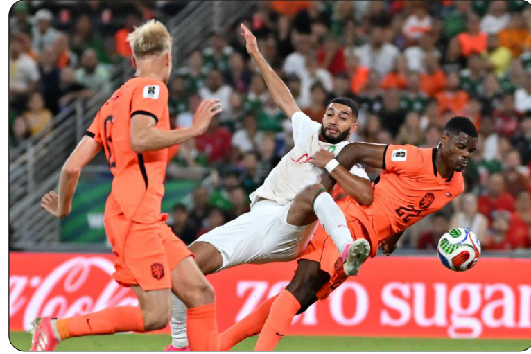
من لقاء المغرب وهولندا