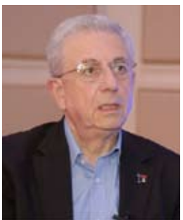
د. مصطفى البرغوثي

كما اعتدنا سابقاً، يواصل كثيرٌ من الساسة والحكام الذين يعترفون بخروج إسرائيل على القوانين الدولية، وبأنها العقبة أمام تحقيق سلام حقيقي في المنطقة، التهرب من مسؤولياتهم بمواجهة السياسات الإسرائيلية، أو اتخاذ إجراءات عقابية ضدها، خوفاً أو تهانواً، ويلجؤون، بالتالي، غطاء لتقاعسهم، إلى المبالغة في ما يمكن أن تحمله الانتخابات الإسرائيلية من تغيير، رايطين الأمر كله بإسقاط تنتياهو وحكومته الفاشية.