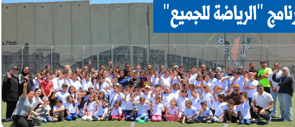
■ مخيم بجانب جدار الفصل

بيت لحم- اختتم مركز شباب عابدة استضافة المخيم الصيفي لبرنامج الرياضة للجميع، بمشاركة منشطين ومنشطات من مخيم عابدة، ومخيم عسكر الجديد، وبيت لحم، وبتير، ومخيم الأمعري، وأريحا.