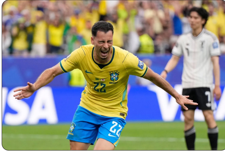
مارتينيلي سجل هدف البرازيل القاتل

وبهذا الفوز، أكد المغرب جدارته بعد مشوار مميز في الدور الأول؛ إذ احتل وصافة المجموعة الثالثة بـ 7 نقاط وبفارق الأهداف عن البرازيل، في حين توقفت مسيرة الطواحين الهولندية التي تصدرت المجموعة السادسة في الدور الأول. وضرب المنتخب المغربي موعداً مرتقباً في دور الـ 16 مع نظيره الكندي، يوم السبت المقبل، على ملعب هيوستن.