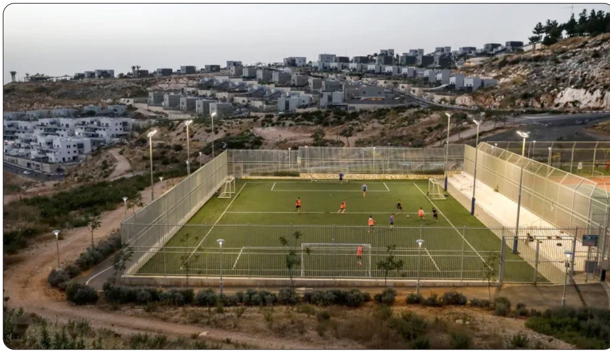
■ ملعب في إحدى المستوطنات

وقالت تومسون: إن نقل المحتوى لاحقا إلى منصة «DAZN» بعد نشر التقرير بأيام أثار تساؤلات، معتبرة أن للنصات الرياضية لا تلعب دورا محايدا فقط، بل قد تسهم في تحسين صورة هذه الأندية ومنح المستوطنات حضورا إعلاميا أوسع. وبينما ترى الحملة الإسكتلندية أن الرياضة أصبحت جزءا من منظومة تثبيت واقع الاستيطان، تظل القضية محل خلاف واسع داخل المؤسسات الرياضية الدولية، بين من يدعو إلى تطبيق اللوائح بحزم، ومن يرى أن كرة القدم يجب أن تبقى منفصلة عن النزاعات السياسية.