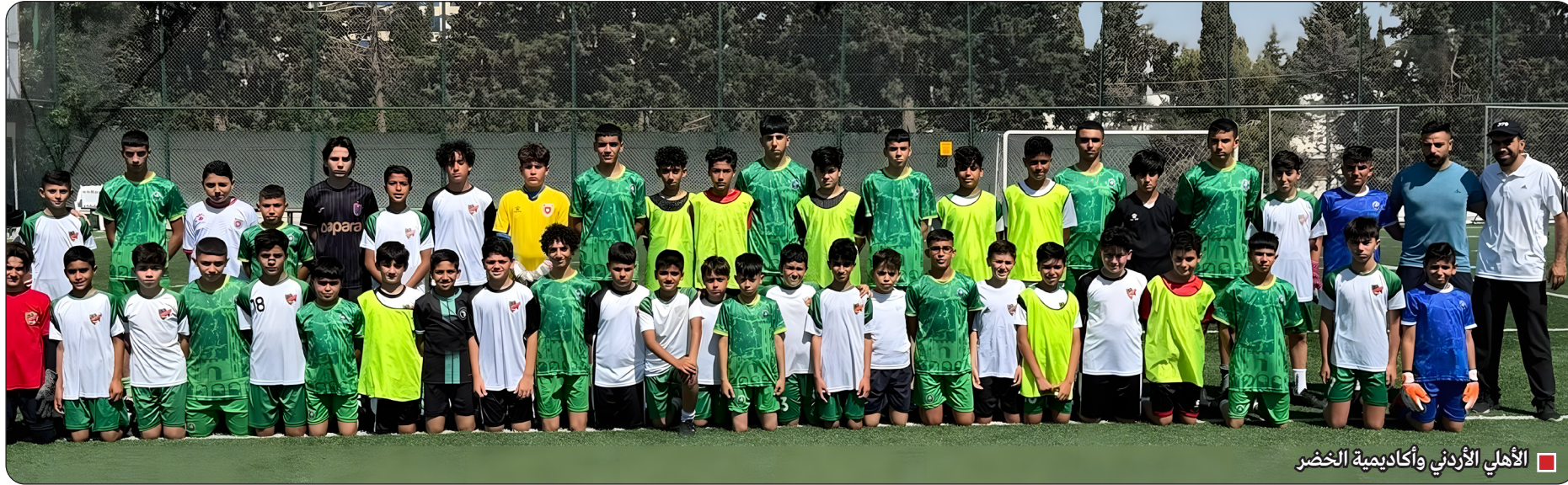
■ الأهلي الأردني وأكاديمية الخضر

بيت لحم - حظيت أكاديمية الخضر للمحترفين باستقبال مميز خلال زيارتها لنادي الأهلي الأردني، في أجواء جسدت روح الأخوة والمحبة بين الأشقاء، على هامش زيارة الأكاديمية للأردن. وشهد اللقاء تقديم درع تذكاري وطقم النادي الرسمي موقعاً من رئيس نادي الأهلي الأردني، في لفظة كريمة تعكس عمق العلاقات الرياضية بين الجانبين. وشكر القائمون على أكاديمية الخضر إدارة نادي الأهلي الأردني على حسن الاستقبال وكرم الضيافة، متمنين دوام التواصل والتعاون الرياضي لما فيه خير وتطوير الرياضة في البلدين الشقيقين