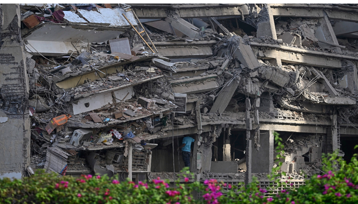
آثار الدمار الذي لحق بمبنى إثر الزلزال الذي ضرب فنزويلا.

كراكاس- ا.ف.ب- قتل ١٨٨ شخصاً على الأقل وأصيب حوالي ألف جراء زلزال مزدوج، هو الأقوى في فنزويلا منذ ١٩٠٠ دفع السلطات إلى إعلان حالة الطوارئ، فيما رأى صحافيون من وكالة فرانس برس مباني منهارة ومشاهد دُحر في كراكاس. وأعلنت الرئيسة بالوكالة ديلسي رودريغيز في حصيلة محدثة، أمس، عن مقتل ١٨٨ شخصاً على الأقل وإصابة حوالي ألف، بعد حصيلة أولى أفادت فيها عن سقوط نحو ٣٢ قتيلاً و٧٠٠ جريحاً. وكانت