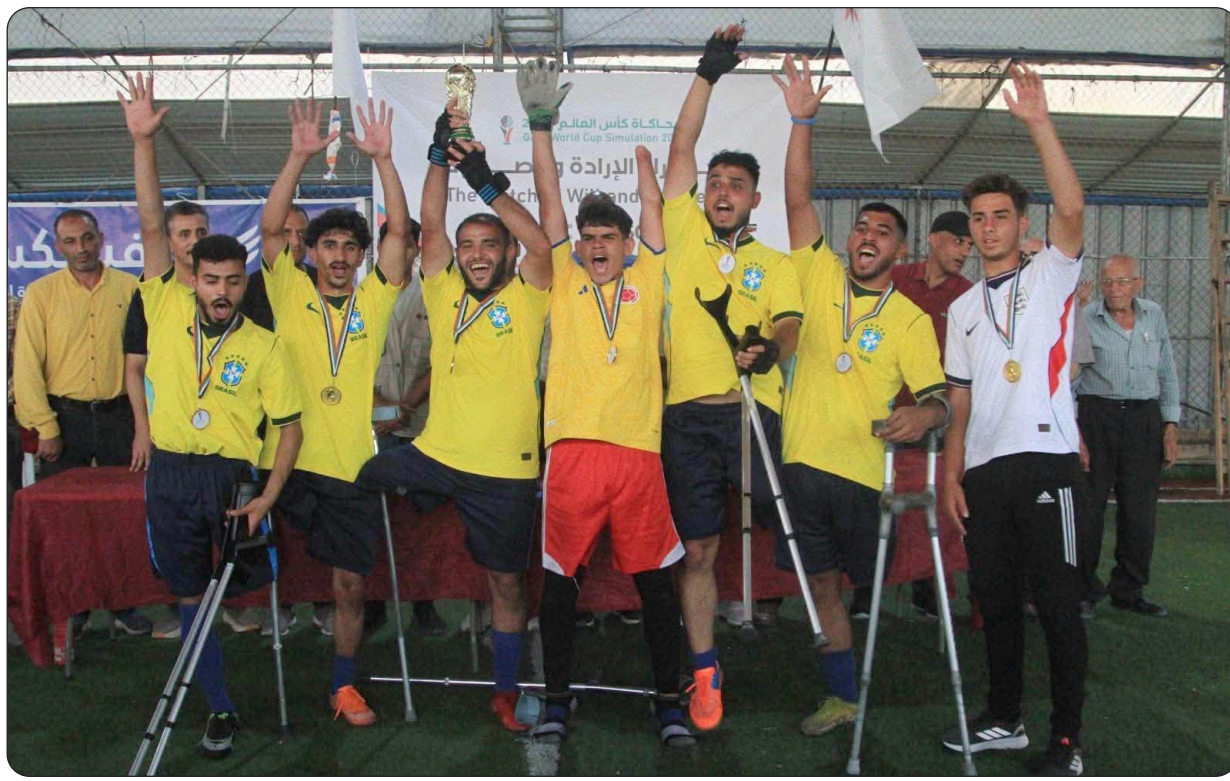
■ فريق البرازيل

دير البلح - اللجنة الإعلامية - احتضن ملعب العنان بمدينة دير البلح وسط قطاع غزة فعاليات محاكاة كأس العالم لأصحاب الإعاقة والعزيمة، وذلك ضمن سلسلة الفعاليات الرياضية الهادفة إلى دعم الرياضيين من ذوي الإعاقة وتعزيز رسائل المحبة والتضامن بين الشعوب، برعاية هيئة الأصدقاء الأمريكية (كوبكرز)، وتنفيذ شركة فينيكس للخدمات اللوجستية والإنسانية. وجمعت المباراة الأولى لكرة القدم للبرازيل والجزائر والبرازيل، في أجواء رياضية مميزة حملت رسائل الوفاء والمحبة للبلدين الشقيقين، اللذين أظهرتا مواقف داعمة ومتضامنة مع أبناء الشعب الفلسطيني وقطاع غزة. وشارك في اللقاء عدد من لاعبي كرة القدم للبرازيل، الذين فقد عدد منهم أطرافهم جراء حرب الإبادة التي تعرض لها قطاع غزة، ليؤكدوا من خلال حضورهم وإصرارهم أن الإرادة أقوى من الألم، وأن الرياضة تبقى عنواناً للأمل والحياة.