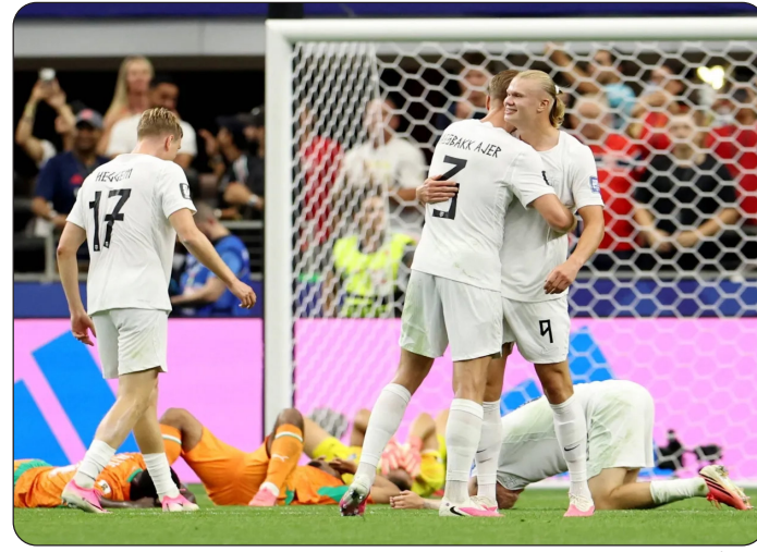
تأهل صعب للنرويج