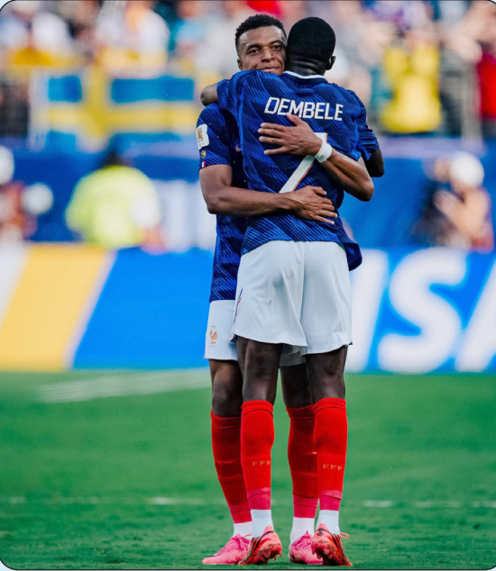
ثنائية مبابي ديمبلي