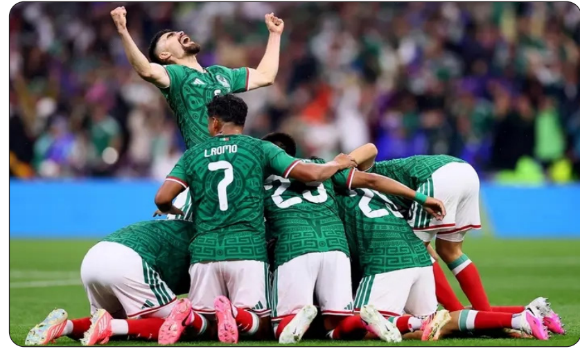
فرحة لاعبي المكسيك

النرويج - ساحل العاج كما حجز منتخب النرويج بطاقة العبور إلى الدور ثمن النهائي، بعدما تخطى عقبة نظيره منتخب ساحل العاج بهدفين في مقابل هدف، سهرة الثلاثاء. وتقدم المنتخب النرويجي في الدقيقة 39 عبر أنطونيو نوسا، لينتهي الشوط الأول بتفوق أوروبي بهدف نظيف، ولكن في الشوط الثاني، انتفضت «الأفيال» الإفوارية بحثاً عن العودة، ونجح أماد دياو لإدراك هدف التعادل في الدقيقة 74. وبينما كانت المباراة تتجه نحو الأنفاس الأخيرة، ظهر النجم إرلينغ هالاند ليتقمص دور البطولة ويخطف هدف الانتصار الثمين للنرويج في الدقيقة 86، مؤمناً عبور بلاده إلى الدور المقبل. وضربت النرويج موعداً نارياً مرتقباً في الدور ثمن النهائي مع المنتخب البرازيلي، الذي كان تأهل على حساب اليابان بالنتيجة ذاتها 2-1.