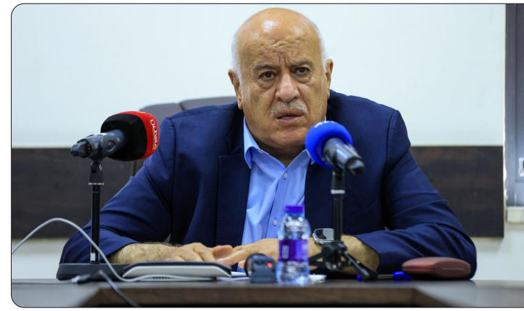
الفريق جبريل الرجوب

المقترح سيكون تشييطا وليس تصنيفا، ولن يتضمن صعودا أو هبوطا، وسيكون مفتوحا أمام جميع الأندية على مستوى المحافظات.