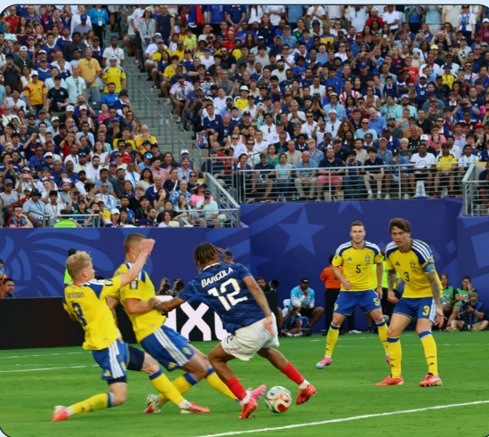
من لقاء فرنسا والسويد