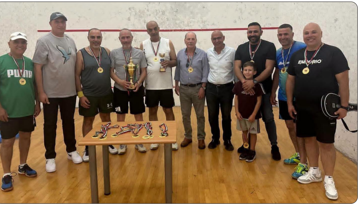
بطولة المرحوم إبراهيم نجم

القدس - احتضن ملعب جمعية الشبان المسيحية في القدس، أول أمس الثلاثاء، بطولة السكواش التنشيطية المفتوحة على كأس الرياضي الراحل إبراهيم نجم، في الذكرى الثالثة للنجم الفلسطيني الكبير.