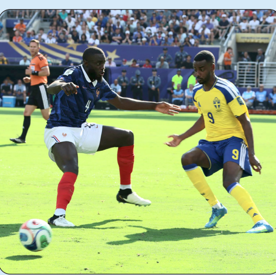
لقطة من المباراة