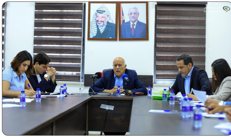
من اجتماع اتحاد الكرة

مع تواصل زحف المنتخبات المرشحة نحو لقب الموندبالي، تتهاطل الأرقام القياسية الفردية والجماعية، وأهمها هذا السباق المُبرّز بين الهادفين مبابي وميسي على لقب الحذاء الذهبي للبطولة ولجمال البطولات، مع إمكانية دخول نجوم آخرين على خطّ لقب هداف نسخة 2026، وخاصةً هالاند، الذي أصبح في رصيده خمسة أهداف.