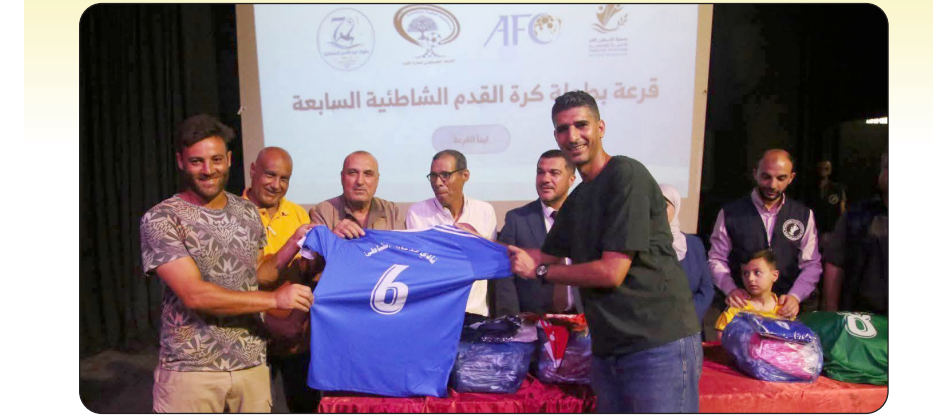
من قرعة البطولة الشاطئية بغزة

وفي ختام البطولة أقيم حفل لتكريم الأبطال والشاركين، استهل بكلمات أشادت بجهود القائمين على تنظيم البطولة، وبالذور الذي يقوم به ملتقى الرواد المقدسي برئاسة المحامي