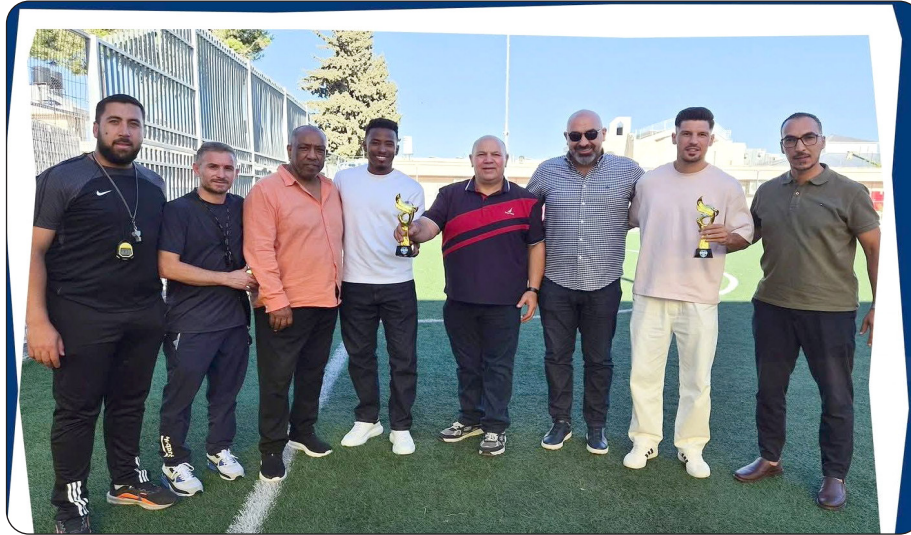
تكريم النجمين صيام وفيراوي

في مختلف المحافل الرياضية، مشيراً إلى أن هذه اللقطة تأتي وفاءً لمسيرتهما الحافلة بالعبء وتحفيزاً للأجيال الصاعدة على مواصلة طريق التميز.